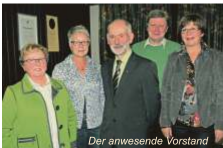
Der anwesende Vorstand

Im Jahre 1985 gab der Heimatverein erstmals ein „Mitteilungsheft“ heraus, das über das verflossene Vereinsjahr in Wort und Bild berichtet.